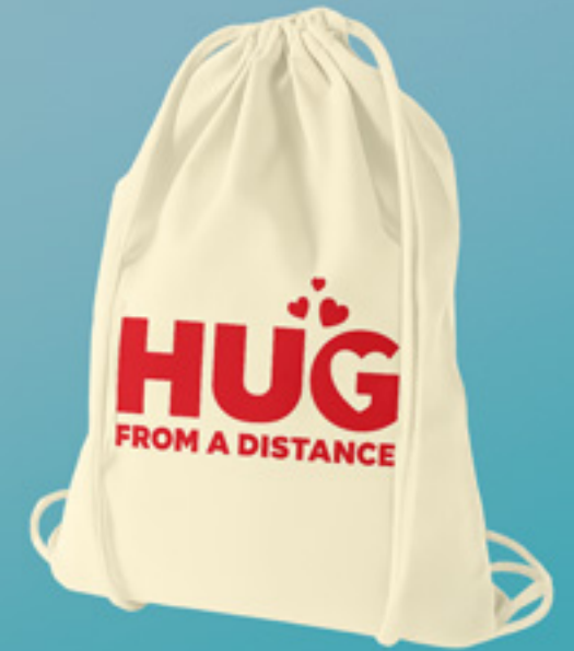
TURNBEUTEL MIT KORDEL