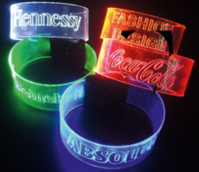
VIP FLASHING BRACELET