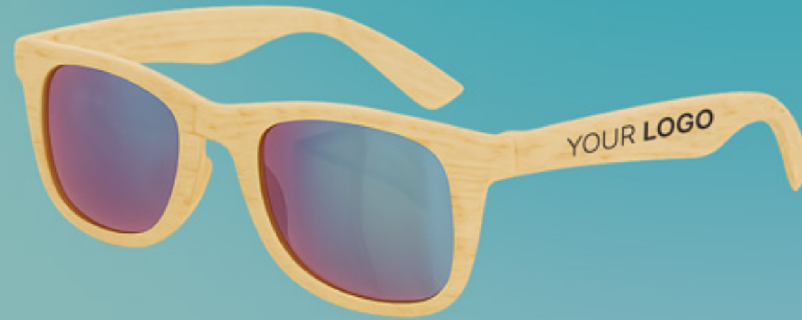
SONNENBRILLE MIT HOLZRAHMEN