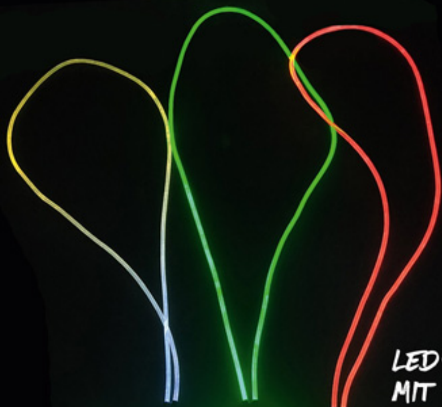
LED-HALSKETTE MIT LEUCHTANHÄNGER