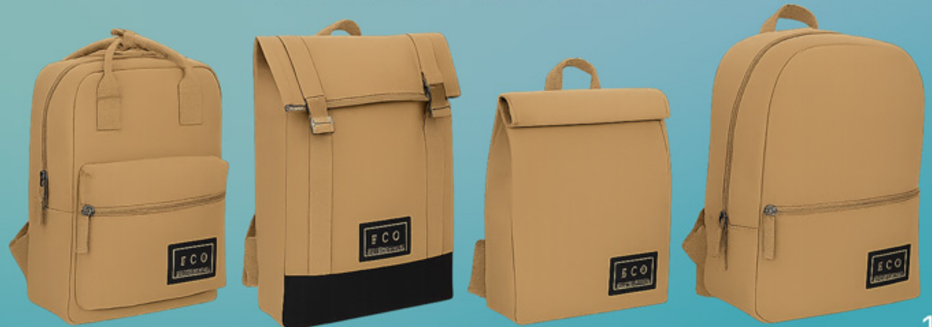
RECYCLBARE WASCHBARE TASCHEN