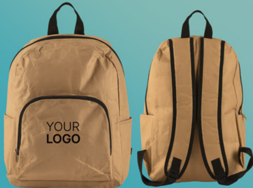
RUCKSACK AUS PAPIER